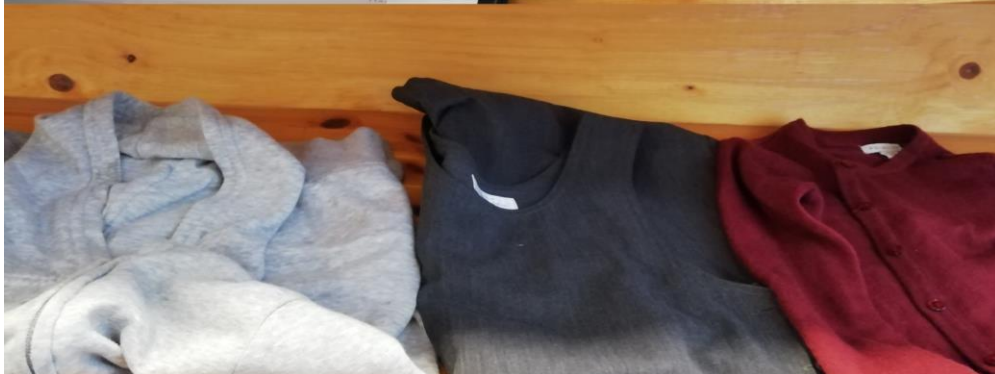
KDV Kleintje Zuid